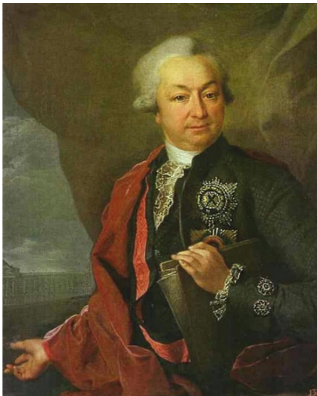
Иван Иванович Шувалов

Племянник Шуваловых — Иван Иванович — в 1749 году станет не без помощи дядьев любовником императрицы, что и позволит создать при дворе перспективную шуваловскую (все ту же пропрусскую) партию, ориентированную на наследника престола Петра Федоровича, противостоящую партии канцлера Бестужева, ориентированной на Священную Римскую империю (Австрию) и Екатерину Алексеевну, жену царевича, как будущую императрицу Екатерину II.