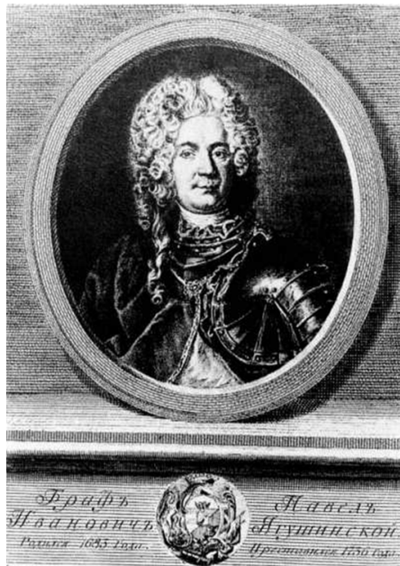
Граф Павел Иванович Ягужинский

У самого Ягужинского было большое семейство от двух его жен. Хитрово родила ему Екатерину, Наталью и Прасковью. Наталья, как мы знаем, стала Головиной. Екатерина — Лопухиной (замужем за Василием Абрамовичем Лопухиным, племянником царицы Евдокии Лопухиной, первой жены царя Петра I). Прасковья — княгиней Гагариной (ее муж князь Сергей Васильевич, впоследствии сенатор, начинал свою придворную карьеру с того, что был камер-юнкером при дворе правительницы Анны Леопольдовны, а 10 марта 1742 года назначен камергером к герцогу Голштинскому Петру-Ульриху, вскоре объявленному наследником русского престола).