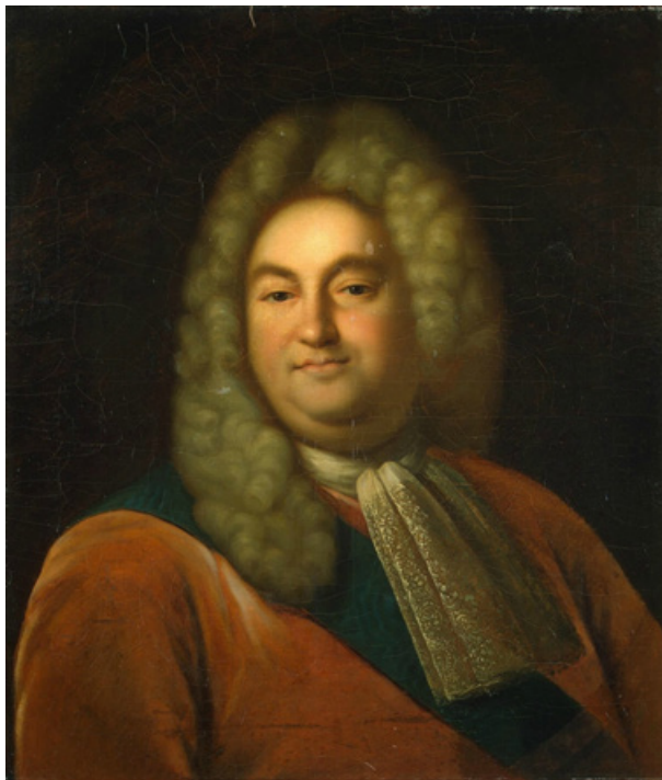
Петр Павлович Шафиров