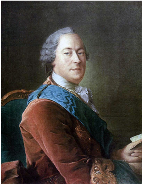
Великий канцлер Михаил Илларионович Воронцов