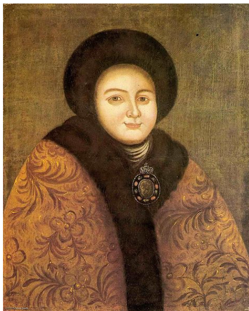
Царица Евдокия Лопухина