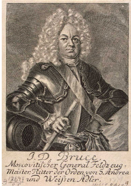
Граф Яков Виллимович Брюс

Генерал-анишефы: Иоганн-Бернгард Вейсбах, позднее — граф, из семьи богемских выходцев; Герман-Иоганн фон Бон, немец; Петр Петрович Ласси, генерал-губернатор балтийских губерний, позднее — фельдмаршал и граф, осужденный на изгнание из Ирландии за приверженность к якобитам; Михаил Афанасьевич Матюшкин, двоюродный племянник царя Алексея; граф Миних, родом из Ольденбурга, генерал-фельдцейхмейстер, генерал-директор <...>, генерал-губернатор Петербурга, вице-президент Военной коллегии <...>; Даниил Павлович Апостол, гетман Малороссии; Язужинский, обер-щталмейстер, а позднее граф, польского происхождения; князь Иван Алексеевич Долгоруков, обер-камергер.