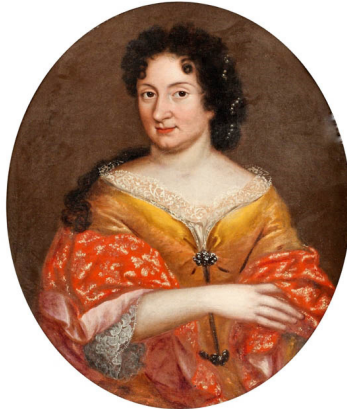
Анна Монс. Неизвестный художник. Предполагаемый портрет.

И для этого есть особые причины, корни которых уходят в далекое прошлое, в самое начало XVIII столетия, когда царь Петр I, сгорая страстью по проживающей в Немецкой слободе Анне Монс, которую в качестве своей собственной любовницы грамотно подложил под царя (который был большой любитель чужих любовниц) его ближайший друг и соратник Лефорт, и желая быть только с ней, обрекает на заточение в монастырь свою законную жену Евдокию Лопухину, мать своего сына, царевича Алексея Петровича. Почти десять лет своей жизни провел царь с «Кукуйской царицей» и даже собрался на ней жениться, как случилось непредвиденное: 11 апреля 1703 года после обильного традиционного возлияния по случаю ремонта царской яхты утонул в Неве саксонский посланник Ф. Кенигсек. Утонул, вероятно, не случайно (Анну Монс ненавидел князь Меншиков): в его бумагах (которые каким-то образом сразу же оказались у князя, хотя сам труп был обнаружен только осенью) были найдены любовные письма от Анны и ее медальон. Этот роман, оказывается, длился уже пять лет. Случайного здесь, конечно же мало: чужих любовниц шпионы использовали в своих целях всюду и всегда, и саксонский посланник не был исключением из этих правил.