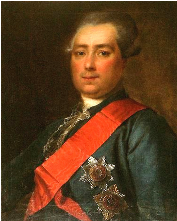
Граф Александр Романович Воронцов

В этой масонской ложе состояла практически вся семья Воронцовых, включая графа Александра Романовича Воронцова, будущего министра иностранных дел (то есть тоже канцлера при Александре I, а его протееже был знаменитый Александр Радищев, с которым позже они входили в ложу «Урания»), родного брата княгини Екатерины Романово-Дашковой, участницы дворцового переворота 1761 года, ближайшей подруги императрицы Екатерины II, муж которой — князь Михаил Иванович Дашков — также был масоном и состоял в этой ложе.