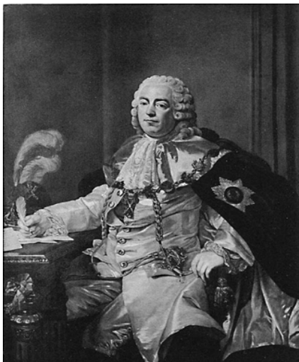
Граф Петр Григорьевич Чернышев