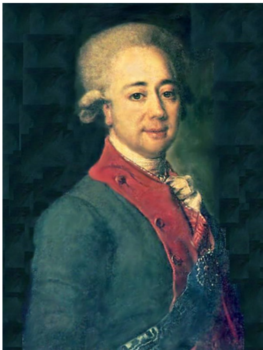
Граф Александр Сергеевич Строганов

У канцлера графа Воронцова не было мужского потомства; его единственная дочь, одна из самых развратных женщин своего времени, вышла замуж за графа Александра Строганова (Александр Сергеевич Строганов, масон, а его сын, Павел Александрович — в молодости якобинец — С. В.). Пользуясь тем обстоятельством, что во время Семилетней войны Венский двор нуждался в поддержании союза с Россией, граф Александр добился в 1760 году графских дипломов для обоих братьев своей жены, Романа и Ивана. В эти дипломы также была включена эта ложная генеалогия, столь дорогая сердцу Воронцовых».