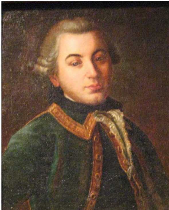
Князь Михаил Иванович Дашков

Екатерина II не доверяла масонам, хотя и вынуждена была вести с ними свою политическую игру. Поэтому, доверив Дашковой быть своим представителем среди придворной аристократии, Екатерина не включила в свое правительство НИКОГО из рекомендованных ею людей и переведя ее саму сразу после переворота на второстепенные политические роли, хотя, говорят, Екатерина Романовна требовала для себя чин полковника гвардии. Вспомним при этом, что фавориткой императора Петра III была Елизавета Романовна... Воронцова.