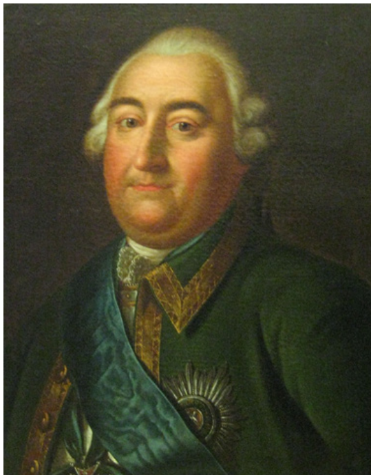
Генерал-фельдмаршал Степан Федорович Апраксин