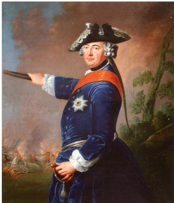
Король Пруссии Фридрих II Великий

«За спиной заговорщиков Шетарди и И. Лестока, организовавших заговор с целью захвата власти, стояли Франция, Швеция и Пруссия, но душою его был прусский король Фридрих II, который щедро оплачивал и Шетарди, и Лестока. Цель Фридриха — способствовать отстранению от русского престола Правительницы, которая (естественно, она ведь была герцогиней Брауншвейгской и приходилась кровной родней царствующему Дому Священной Римской империи — С. В.) придерживалась враждебной Пруссии австрийской ориентации, а также в перспективе провести на русский престол благоговевшего перед ним с детства племянника, голистинского герцога, сына дочери