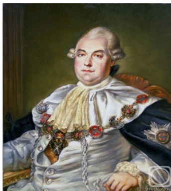
Граф Роман Илларионович Воронцов

Интересно, что все тот же П. В. Долгоруков, столь высоко и поэтично отзывавшийся о франкмасонах России, дает самую уничижительную характеристику главе первой русской масонской ложи, в которой, по всей видимости, первоначально и состоял боготворимый князем Долгоруковым Иван Иванович Шувалов: