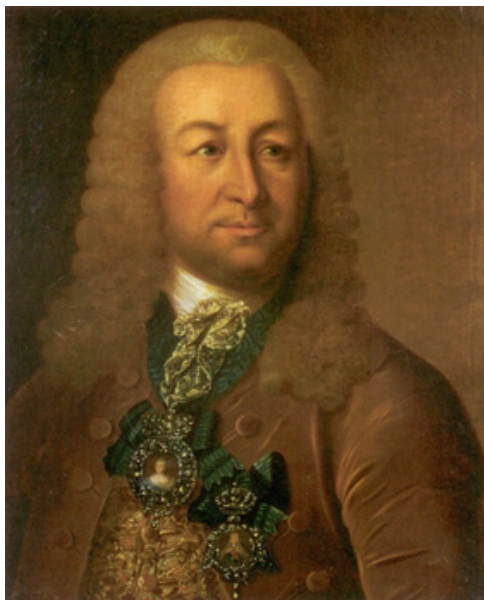
Иоганн Герман Лесток

И здесь нам нужно сделать необходимое отступление.