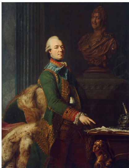
Граф Захар Григорьевич Чернышев