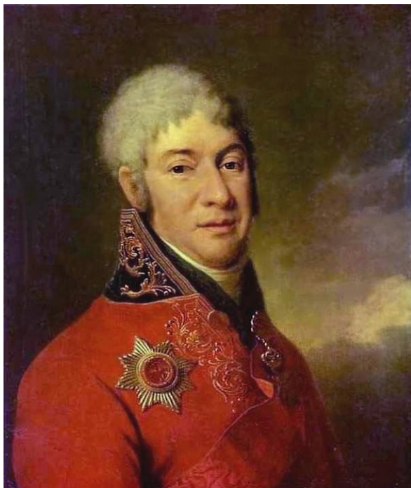
Левицкий Д. Г. Иван Владимирович Лопухин

Но если сам Иван Степанович Лопухин оставил в русской истории весьма призрачный масонский след, то его родственник — Иван Владимирович Лопухин — достиг на этом поприще высот небывалых: