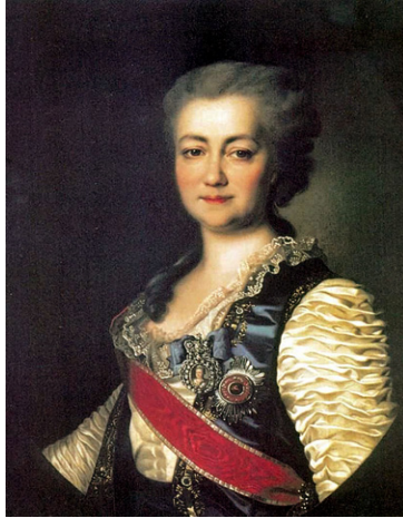
Екатерина Романовна Дашкова (Воронцова), фаворитка императрицы Екатерины II