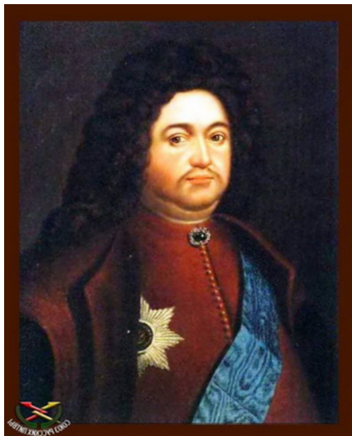
Федор Алексеевич Головин

Но не это удивительно: Головин состоял в свойстве с виднейшими из петровских сподвижников: А.Д. Меншиков был ему свояк (брат Головина Алексей был женат на сестре Александра Даниловича Марфе); Борис Шереметев, Петр Шафиров, Борис Голицын были ему сватами, Павел Ягужинский и Аникита Репнин приходились сватами его сыновьям.