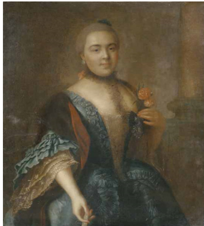
Елизавета Романовна Воронцова, фаворитка императора Петра III