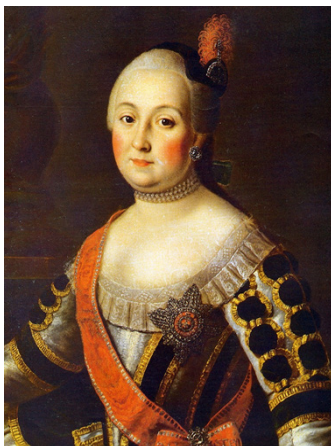
Графиня Анна Карловна Воронцова (урождённая графиня Скавронская) — жена канцлера графа Михаила Илларионовича Воронцова, двоюродная сестра императрицы Елизаветы Петровны, статс-дама

престол; если бы этот заговор провалился, то ночное предприятие получило бы имя бунта; Воронцов и его соумышленники были бы биты кнутом и сосланы в каторжные работы в Сибирь; но предприятие преуспело и было увенчано именем революции, а Воронцов вскоре стал большим вельможей. В тот же день, 25 ноября, он был пожалован в камергеры; а 31 декабря произведен в чин генерал-лейтенанта. В первые недели 1742 года он женился на княжне Анне Скавронской, кузине императрицы; в день коронавания императрицы, 25 апреля, его жена была пожалована в статс-дамы; сам он получил ленту ордена Св. Александра Невского, так же как и его семидесятилетний, уже удалившийся со службы отец, которому императрица пожаловала в этот день чин действительного статского советника, а через короткое время после этого — и тайного советника (этот старец умер в 1750 году, в возрасте 76 лет).