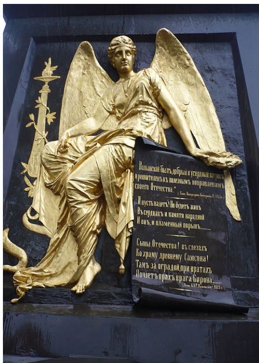
Памятник А. Волынскому, А. Хрущову и П. Еропкину

Но пример оказался заразительным: гораздо удобнее, оказывается, было теперь чинить вред Отечеству, надев личину патриота.