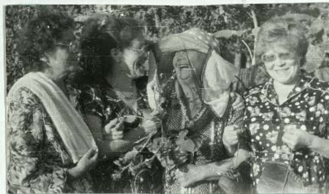
Дружна во всем - и в смехе тоже.