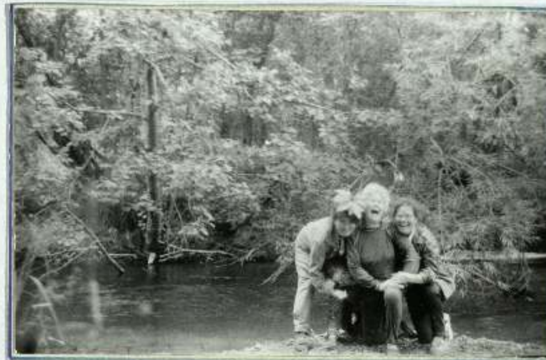
ТАК НА КОМ ДЕРЖИТСЯ МИР?